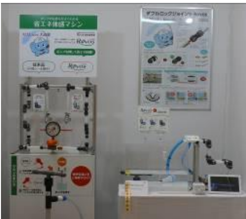
『樹脂製エルボ型ワンタッチ継手 「Revos」なめらかエルボ』 株式会社オンダ製作所