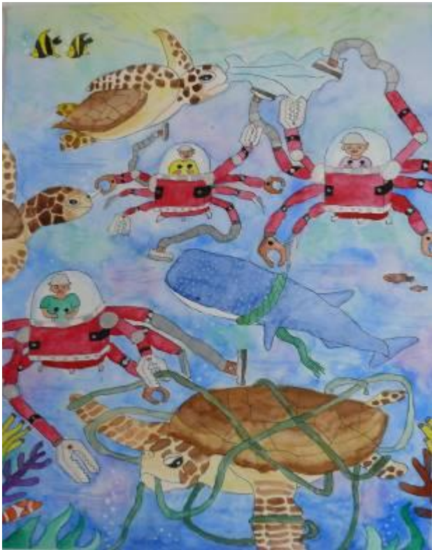
『海洋生物救助ロボ』