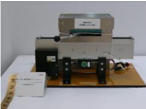
『机上・床上搬送装置「ランマスター」』 中洲電機株式会社