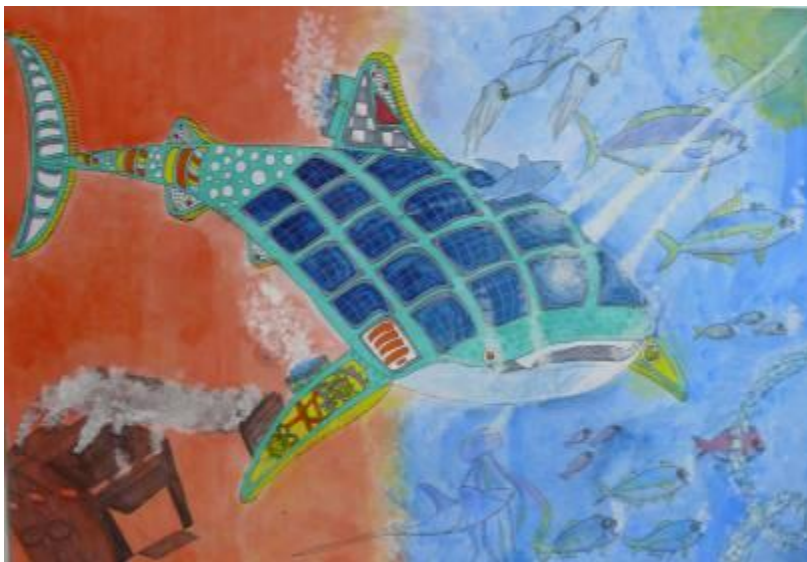
『温暖化のない未来』