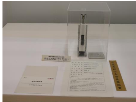
■日本弁理士会会長奨励賞 名称：錠剤分割装置 受賞者：中洲電機(株)