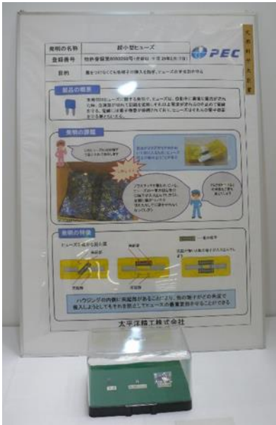
■文部科学大臣賞 名称：超小型ヒューズ 受賞者：太平洋精工(株)