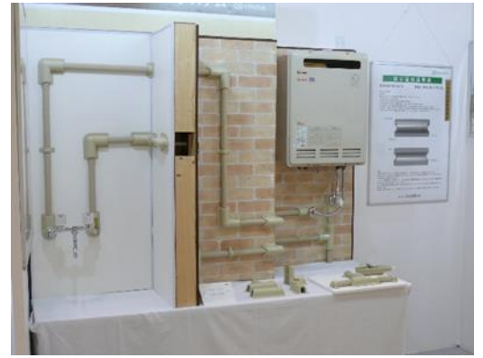
■中部経済産業局長賞 名称：スポットカバーシステム 受賞者：(株)オンダ製作所