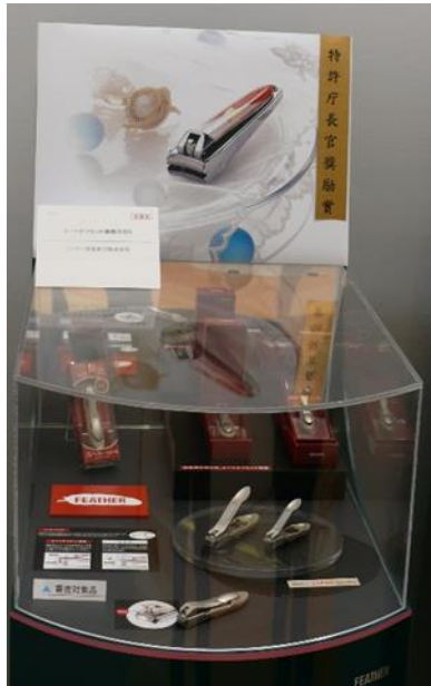
■特許庁長官奨励賞 名称：オートオフセット機構爪切り 受賞者：フェザー安全剃刀(株)