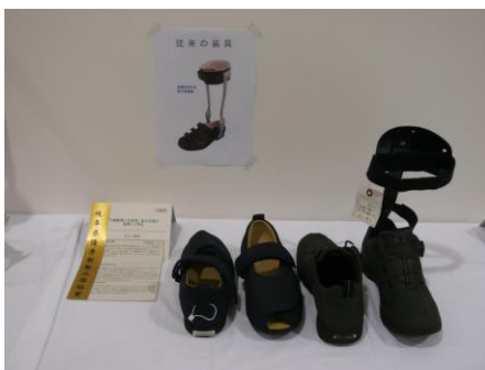
■岐阜県優秀新製品奨励賞 名称：下肢装具に大革命、自分の靴を装具にできる 受賞者：堀江 耕太