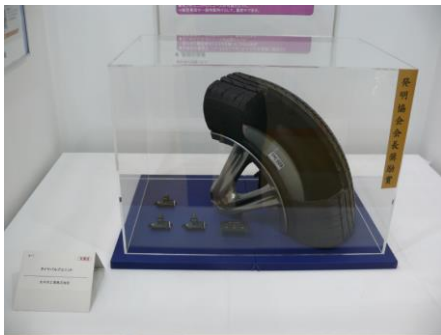
■発明協会会長奨励賞 名称：タイヤバルブユニット 受賞者：太平洋工業(株)