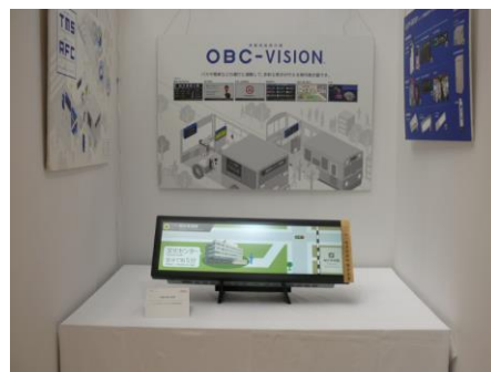
■一般社団法人岐阜県発明協会会長賞 名称：液晶式表示装置 受賞者：レシップホールディングス(株)