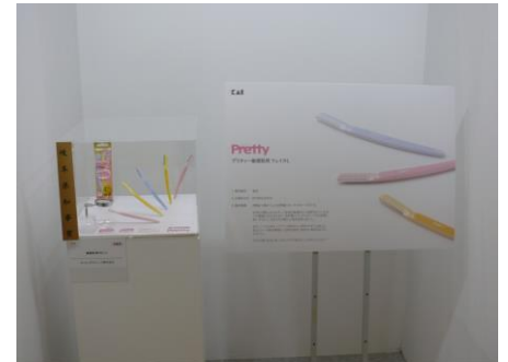
■岐阜県知事賞 名称：敏感肌用カミソリ 受賞者：カイインダストリーズ(株)