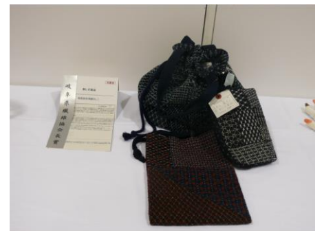
■岐阜県繊維協会会長賞 名称：刺し子製品 受賞者：(有)飛驒さしこ