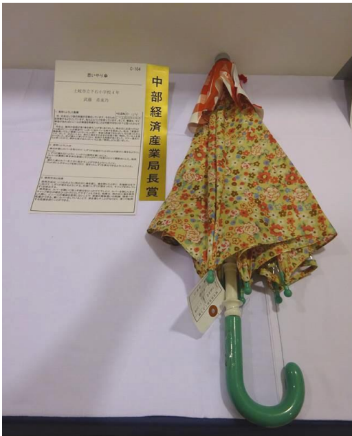
『思いやり傘』 と き し り つ お ろ し し ょ う が つ こ う 土岐市立下石小学校 4年