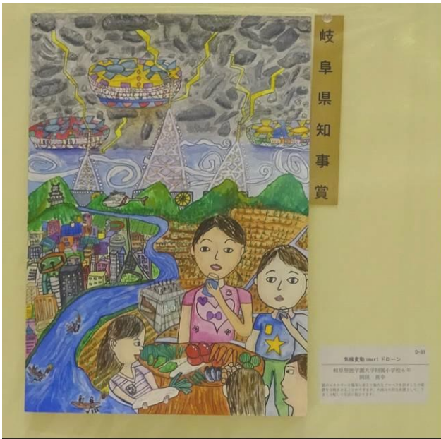
『気候変動 smart ドローン』

ぎふしょうとくがくえんだいがくふぞくしょうがっこう 6年 岐阜聖徳学園大学附属小学校