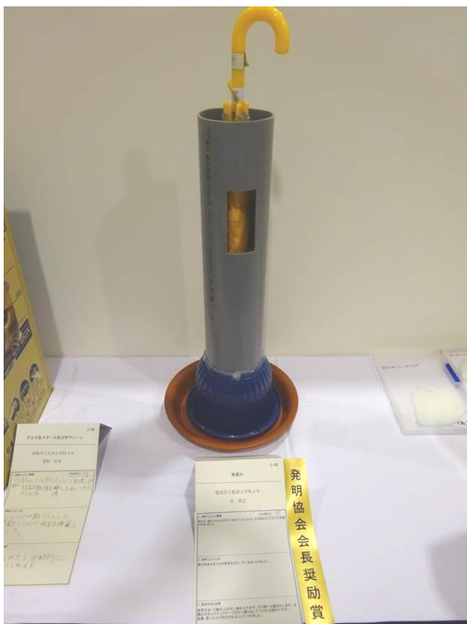
『傘畳み』 み づ な み し り つ い な つ し ょ う が つ こ う 瑞浪市立稲津小学校 4年