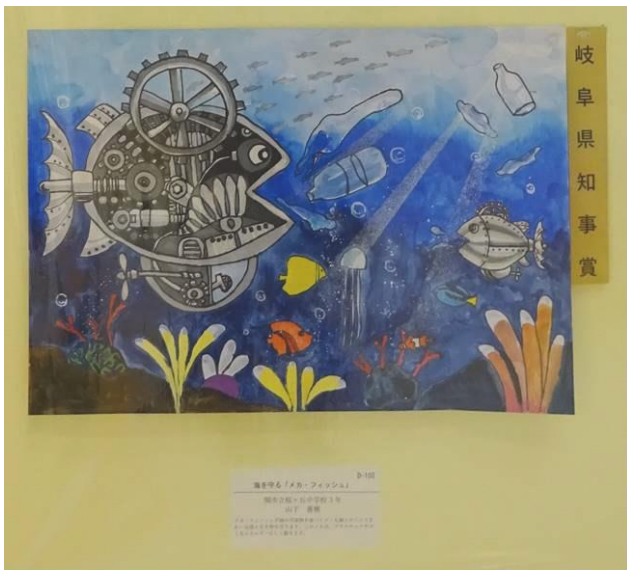
『海を守る「メカ・フィッシュ」』