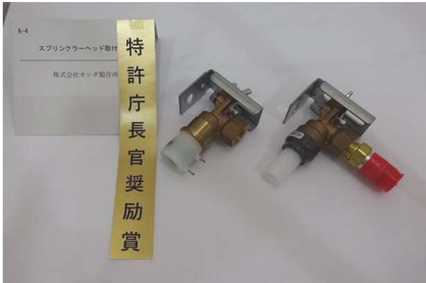
『スプリンクラーヘッド取付継手』 株式会社オンダ製作所