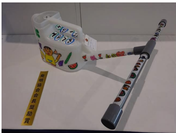
『らくらくじょうろ』