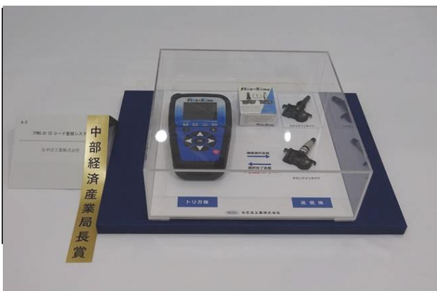
『TPMSのIDコード登録システム』 太平洋工業株式会社